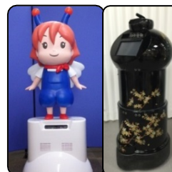
図 4. T 型ロボットベースを用いた案内ロボット