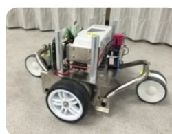
図 3. T 型ロボットベース