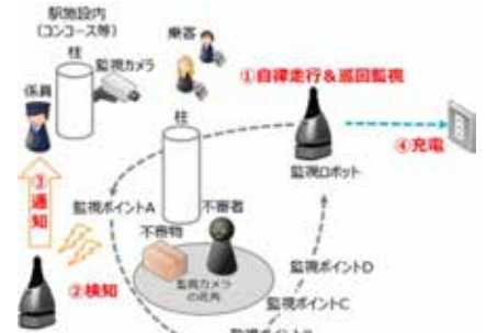
警備ロボットの概要