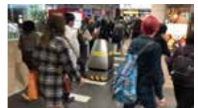
西武新宿駅での 実証実験模様