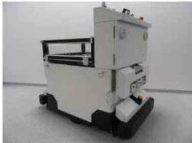
大型ロボットベース「Taurus」

300kgの重量物を搭載可能で、その場旋回が可能で6輪の駆動体の「トーラス」を開発しました。その応用として、共同研究にて、駅での警備ロボット「ペルセウスボット」に対して技術移転を行い、倒されにくいロボットを実現しました。