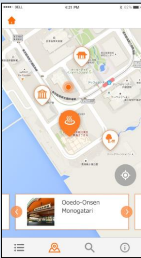
図1. 言語を用いないシステム