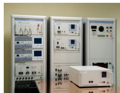
過渡電圧サージ試験機

アンテナ照射イミュニティ試験（ISO 11452-2） 車両内外からの放射性ノイズによる誤動作への耐性を確認する試験