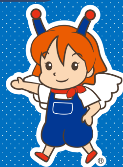
マスコットキャラクター テリノ