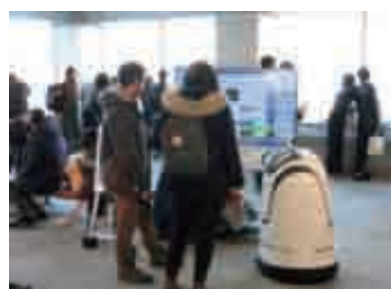
図1 都庁舎第一本庁舎45階南展望室での実証実験の様子