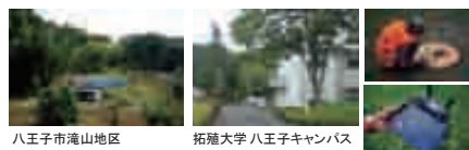
八王子市滝山地区