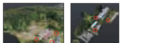
集水シミュレーションより危険箇所を推定。現地にて増水時の危険箇所を確認した。