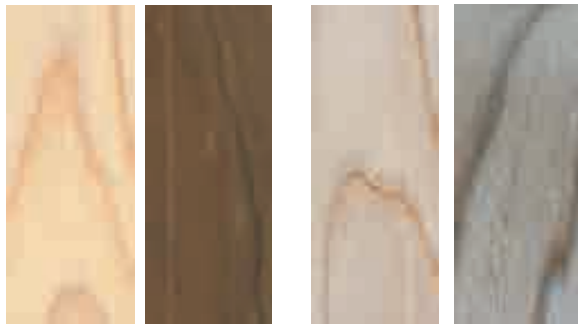
無処理木材 熱処理木材 無処理木材 熱処理木材 促進耐候試験前 促進耐候試験500時間後