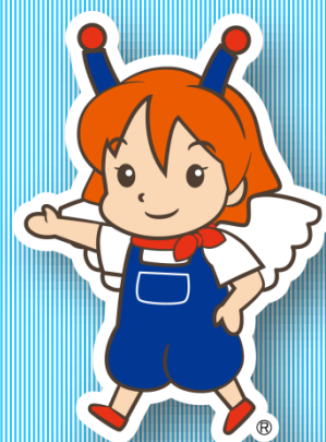
マスコットキャラクター テリン®