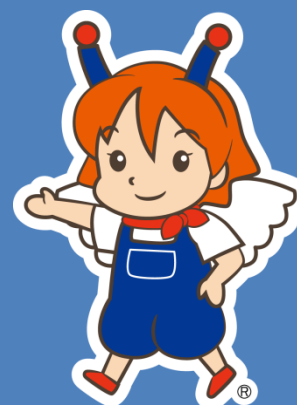
マスコットキャラクター テリン®

本講座では、既存製品のスペックシートを中心に、仕事に役立つ項目をピックアップし、どのような量なのか、どのようにして測定を行うのかを具体的に例示します。さらに、その応用として照明製品を評価する照度シミュレータ DIALUX の簡単な使い方について解説します。