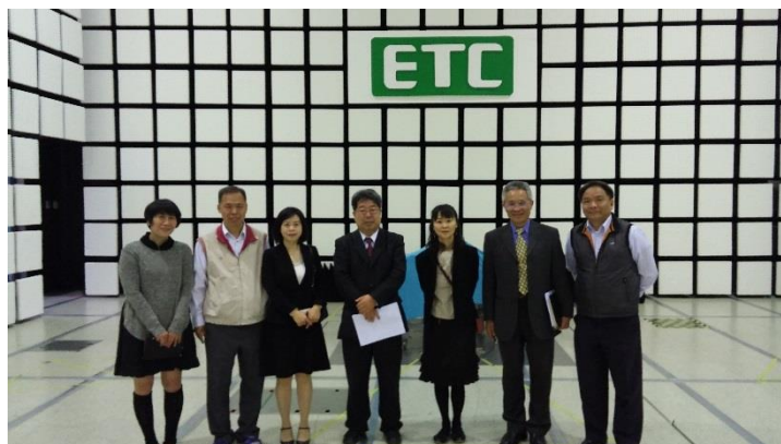
ETC 10m 電波暗室内にて

製品安全試験、EMC 試験、電気通信 端末機器試験、ソフトウェアテスト、 環境・信頼性試験、ケーブル・コネ クター試験、二次電池試験、光学試 験、化学試験、グリーンマークテ スト、エネルギーラベルのテスト、グ リーンビルディング材料試験、音圧 とサウンドのパワーテスト