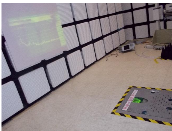
AUDIX 10m 法暗室 床下プロジェクターとスクリーン

また、ノイズ対策を実施しながら測定を行うことを想定し、測定室内の測定器を電波暗室内でもモニターできるように、床下にプロジェクターを配置、電波暗室壁面に投影、ノイズレベルを確認しながら対策が行うことができる。(ノイズ対策は通常、測定器を暗室内に持ち込むが、ケーブル配線などの時間短縮が可能。)