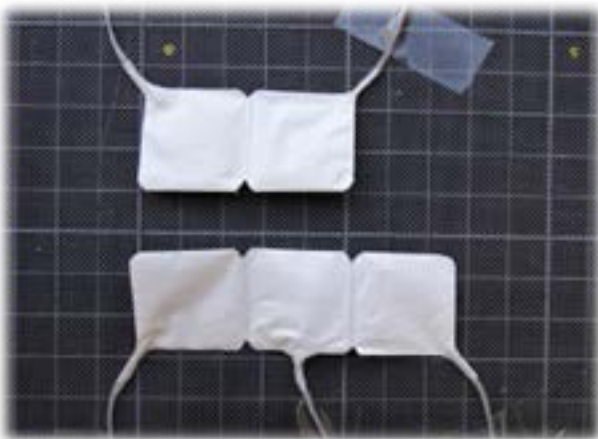
図1. 連続した点の測定に用いる多連エアパックセンサ (上)25mm角二連センサ, (下)25mm角三連センサ