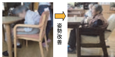
図3. 背中が曲がった高齢者のための椅子