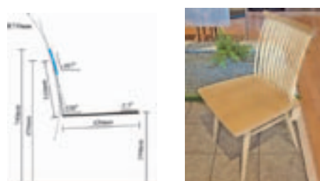
図2. 設計指針と商品開発例