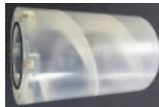
図2. ラボスケールの反応槽試作品