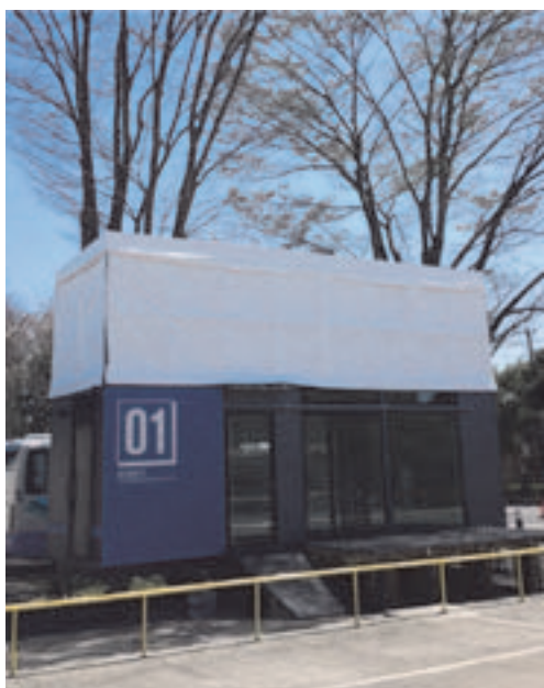
図1. トレーラーハウスのプロトタイプ

これまでの筆者の取り組みとしては、二階建てに展開可能なトレーラーハウス（図1）のデザインを行った。規格としては、幅2.5m、長さ8m、高さ（二階折りたたみ時）3.8mで、運搬時には二階部分を折りたたみ、設置時には折りたたんだ二階部分を展開するものである。本トレーラーハウスの用途は、図2のようなことを想定している。本研究では、日本の都市スケールにあった、さらにコンパクトなトレーラーハウスのデザインを考える。