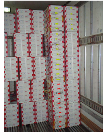
図1 イチゴの積載状況