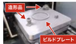
造形終了後の状態