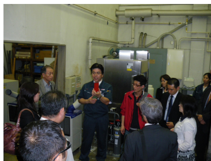
平成21年度MACC産学交流会