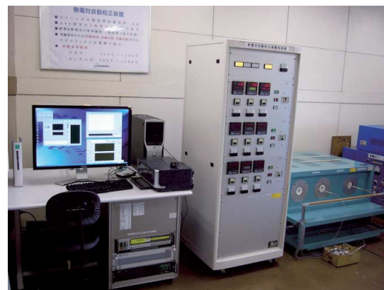
図3 熱電対自動校正装置

図3は当センター保有の熱電対自動校正装置です。標準器の管理から電気炉の制御、測定さら