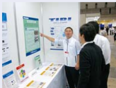
昨年の JPCA Show 出展の様子

日 時 平成27年6月3日(水)～5日(金) 10:00～17:00 会 場 東京ビッグサイト(江東区有明3-10-1) 東ホール 入 場 料 1,000円(税込) ※招待券持参者・事前登録者は無料 出展内容 情報技術グループの研究紹介 他