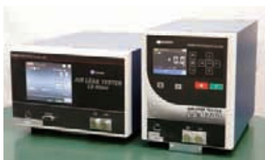
エアリークテスター LS-R900、LS-R700 使いやすさを大幅に向上させた新製品

出展内容：・多摩テクノプラザのEMCサイトの紹介 ・電子・機械グループの研究紹介 など