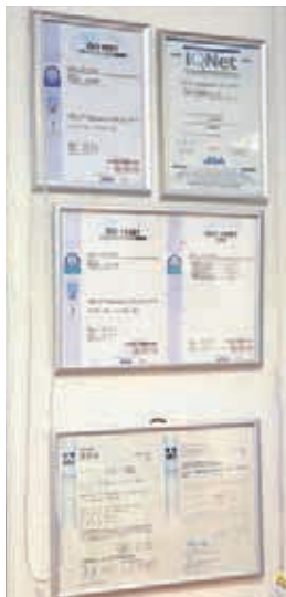
ISO 9001、ISO 14001、 ISO/IEC 17025 の認定証

当サイトは、電波暗室3基、シールドルーム2基を整備しています。その中で10m法電波暗室は、(株)電磁環境試験所認定センター(VLAC)より、ISO/IEC 17025 認定サイトとして登録されています。情報通信技術装置の規格適合試験では、英文の試験成績書も発行可能です。