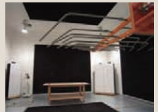
電波ノイズ試験室

機器利用専用設備である3m法電波暗室およびシールドルーム1は、ホームページで空き状況を確認することができます。