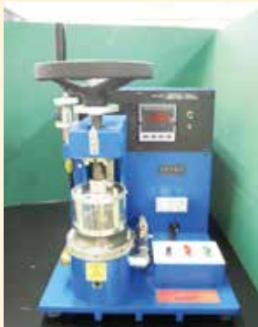
ミュールン低圧形破裂試験機

試験片を締付板に締め付けて、ゴム隔膜を介して膨らませ、試験片が破壊した時の強さを測定します。ニット生地では、他の方法で強さが正確に求めにくいいため、この破裂強さで評価するのが有効です。