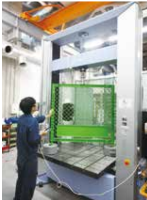
大型製品の試験例

製品開発や品質管理において、製品の故障や事故を未然に防ぐために、構成している機械要素や使用している金属材料の強度を確認・検証することは必要不可欠です。本装置では、製品や金属材料に最大で100 kNの圧縮・引張荷重を負荷し、耐荷重、破壊状況、引張強さ、伸びおよび絞りなどの機械的性質を調べることができます。さらに、試験空間が広いので、従来よりも大型・長尺製品の試験に対応しています。