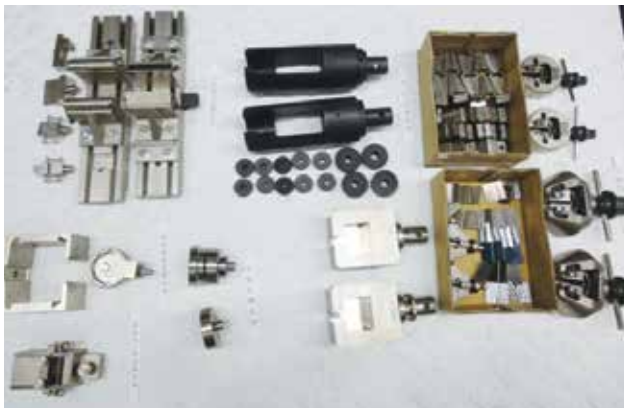
多種多様な試験治具