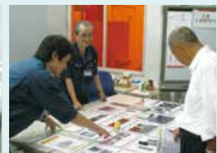
お客さまから関心の高かった X線透視装置