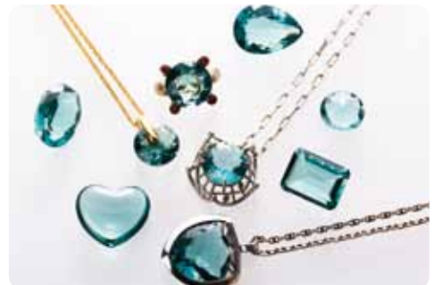
三宅ガラスジュエリー