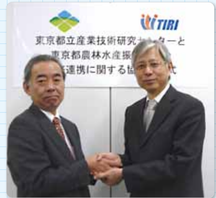
▲松本理事長(左)と片岡理事長

なお、東京都農林水産振興財団が、単独の機関と協定を結ぶのは、今回が初めてとなります。