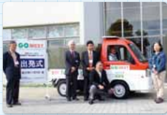
▲GO WEST出発式(多摩テクノプラザ本館前) 約8時間の充電で約70km進むことができます

「次世代自動車技術研究会」は、多摩テクノプラザを中心に活動する技術研究会で、電気自動車(EV)やハイブリッド、燃料電池車などの次世代自動車技術について情報交換を行っています。