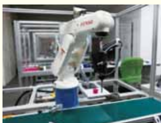
シリアルリンク型 (株式会社デンソーウェーブ)