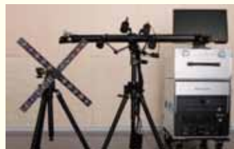
ステレオ視3次元 変位計測システム (PONTOS) (高速度カメラ MEMRECAM GX-8併用可能)