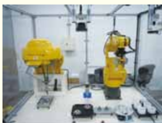
左: パラレルリンク型, 右: シリアルリンク型 (ファナック株式会社)

品質向上等を目的とした産業用ロボット導入をお手伝いします。各種産業用ロボットのご試用も承っています。また、活用のための講習会を実施しています。