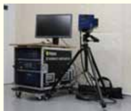
スキャニングレーザ振動計 (Polytec PSV-400)