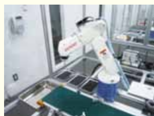
ミドルウェアにより 制御され動作するロボット