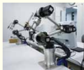
シリアルリンク型 (分解学習用) (安川情報システム株式会社)