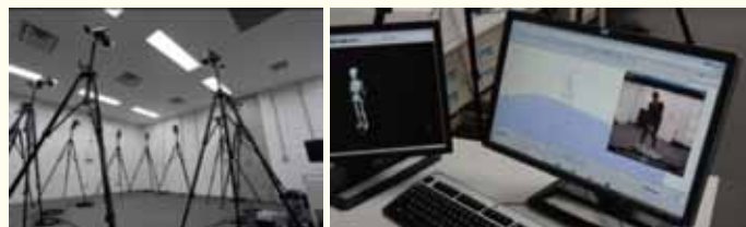
モーションキャプチャシステム (MAC 3D System)