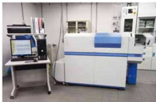
図1 スパーク放電発光分光分析装置

また、指定外の材料を使用した製品や、材料中の不純物元素は、製品や材料の性能低下を招くことがあります。スパーク放電発光分光分析による異材判定や不純物元素の特定・定量は、性能低下の原因を解明する手段の一つとして有効です。