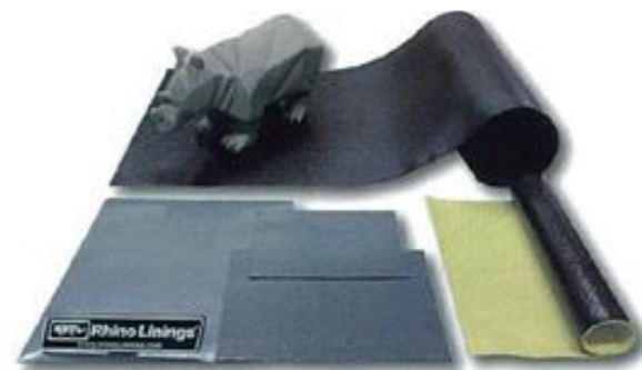
上段: ポリウレアシールドウォール 下段: ポリウレアシート