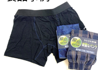
尿臭カット効果のあるパンツ