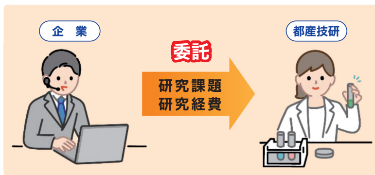
受託研究による製品開発

都内中小企業などからの委託に基づいて、都産技研が短期の研究・調査を行います。随時受付を行っており、企業の研究課題に素早く対応できます。研究費は企業負担となります。