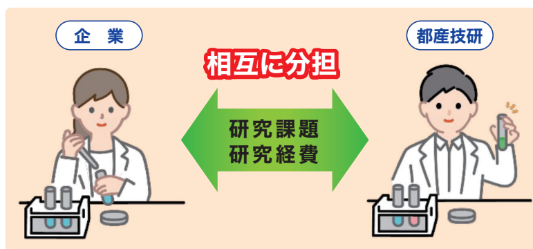
共同研究による製品開発

都産技研と都内中小企業や大学・公的研究機関などが、相互に経費と研究課題を分担して、技術開発や製品開発を行います。都産技研ウェブサイト、TIRI NEWS、メールニュースなどで募集のご案内をしています。