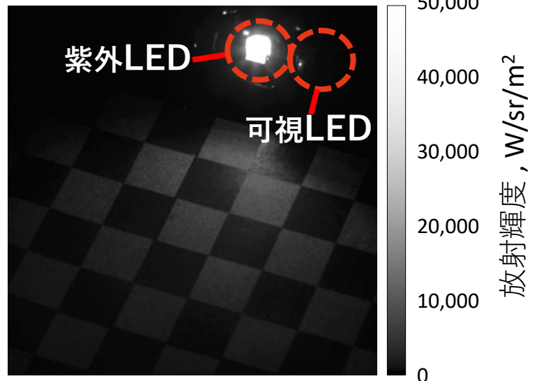
開発したシステムで測定