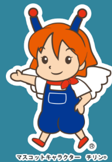
マスコットキャラクター チリン