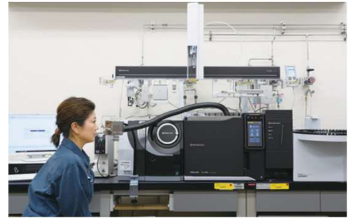
消臭効果の検証に使用する装置（におい分析システム）

菌やウイルスの対策など「におい」対策グッズが増えていますが、「尿のにおい（尿臭）」は個人・環境の差や衛生面から実際の尿を使った実験ができません。試薬（模擬臭）や評価方法がないことから、「下着についての尿臭」の抑制・消臭効果の評価をすることは困難でした。