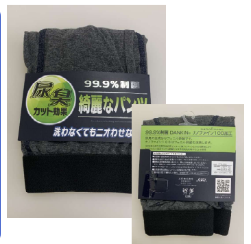
製品化した男性向け下着

ナノファイン100を含むナノファインシリーズは、(株)プロテック（港区）が開発・販売している繊維製品用加工剤で、制菌性能（抗菌機能より高度な技術）が特徴的な酸化亜鉛を主成分とした製品です。洗濯しても機能が持続することが特徴の一つであり、さまざまな素材の繊維製品の形状や用途に併せて使用できることから、多くの製品の加工剤として活躍しています。