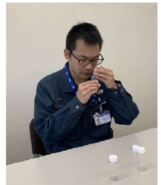
臭気判定士による 嗅覚試験

尿臭への効果を検証するうえで必要となった模擬尿臭は、ヒトの嗅覚を使った官能評価により完成しました。これは、「尿臭だ!」と判断するのは人間の脳（記憶）であり、分析機器にはできないためです。特に、尿臭のようなさまざまな成分が混合してできた複合臭の評価は、人間の嗅覚が最も得意とする分野です。そのため、人間がイメージする尿臭を作るためには、人間を使って評価するしかありませんので、「調合→評価」を繰り返し、最終的に多くの方がイメージする尿臭の調合に成功しました。この技術は特許出願中です。