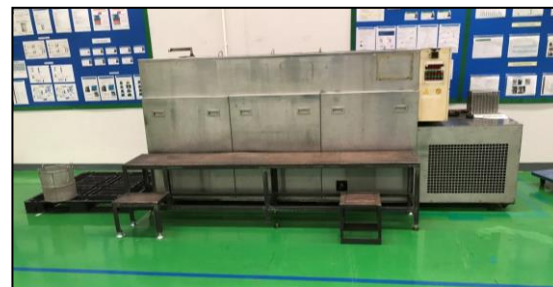
4槽式トリクレン洗浄装置