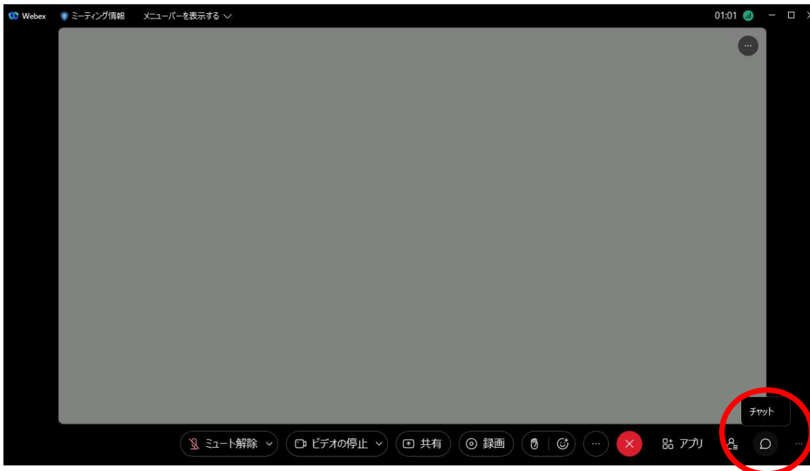
図 1 Webex の画面右下のチャットボタンをクリック

รูปภาพที่ 1 คลิกปุ่ม แชท ทางขวามือด้านล่างของหน้า Webex