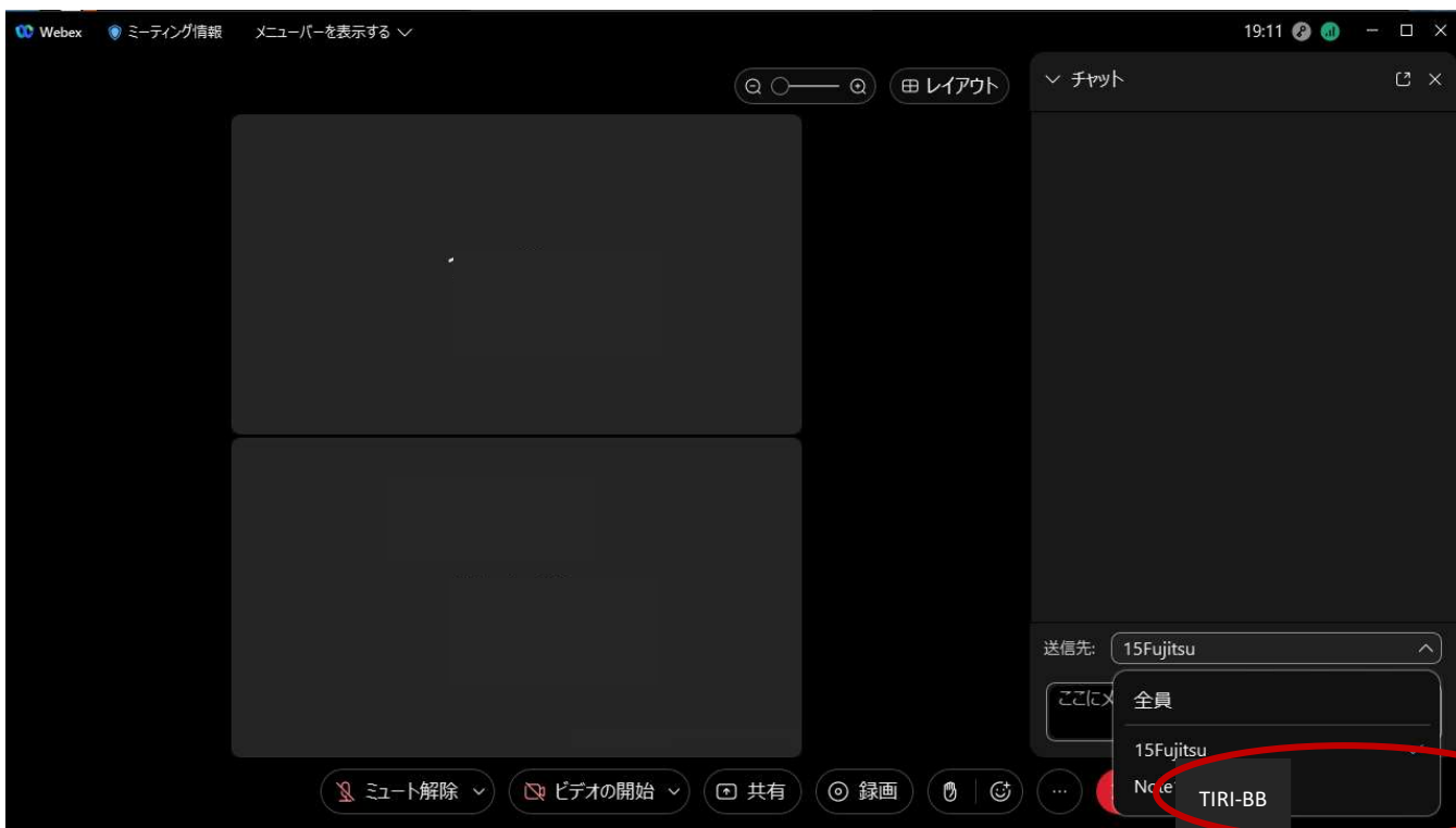
図 2 全員ではなく、司会者(TIRI-BB)を選択して、送信ください

รูปภาพที่ 1 คลิกปุ่ม แชท ทางขวามือด้านล่างของหน้า Webex