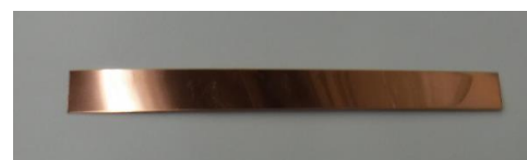
図 3 試験後の様子