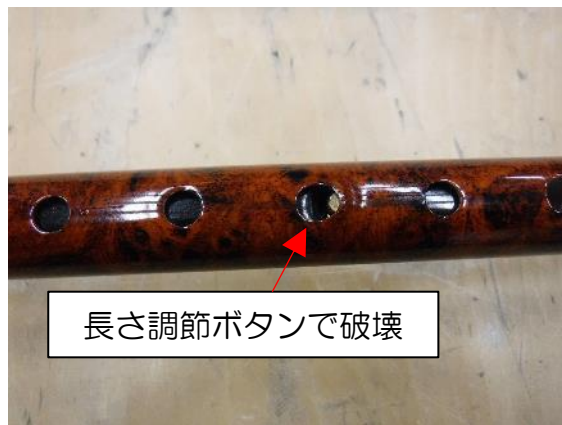
図 3 試験後の様子