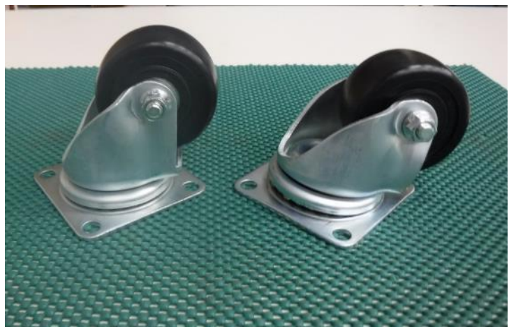
図 3 試験後の様子