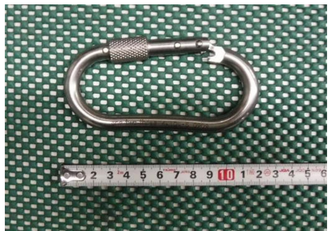
図 3 試験後の様子