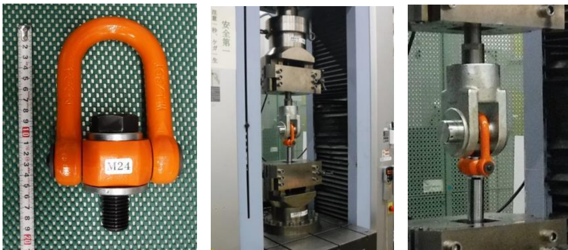
図 1 試験の様子