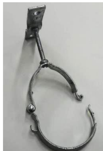
図 3 試験後の様子