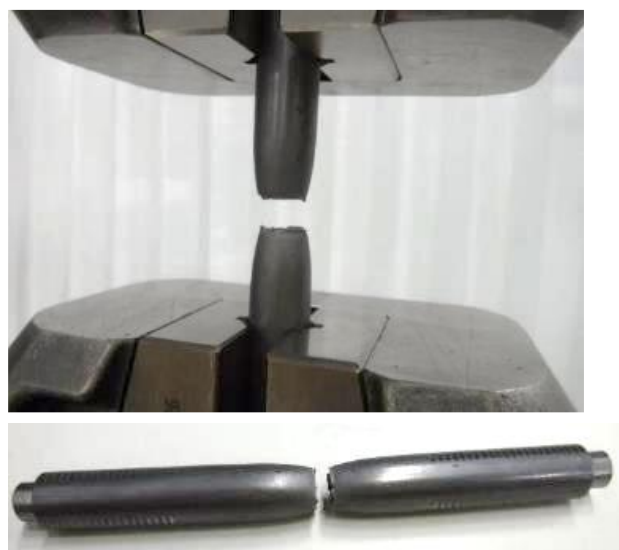
図 3 試験後の様子