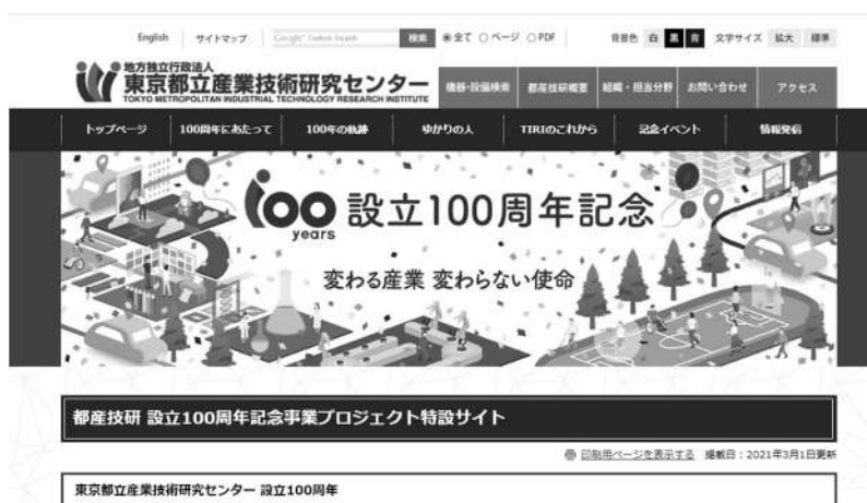
図 100周年記念特設ウェブサイト

10月15日にプレス発表と同時に、「100周年記念特設ウェブサイト」を公開した。ウェブサイトは「トップページ」「100周年にあたって」「100年の軌跡」「ゆかりの人」「TIRIのこれから」「記念イベント」「情報発信」の計7ページから構成された。