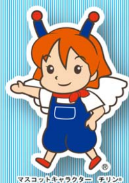
マスコットキャラクター チリン