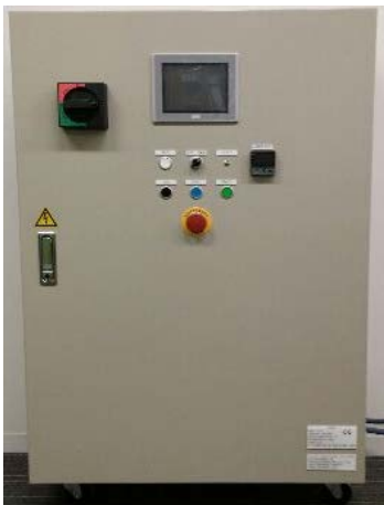
実機サンプル外観