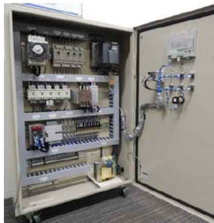
実機サンプル内部