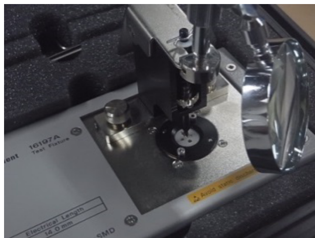
写真2. テスト治具16197A外観