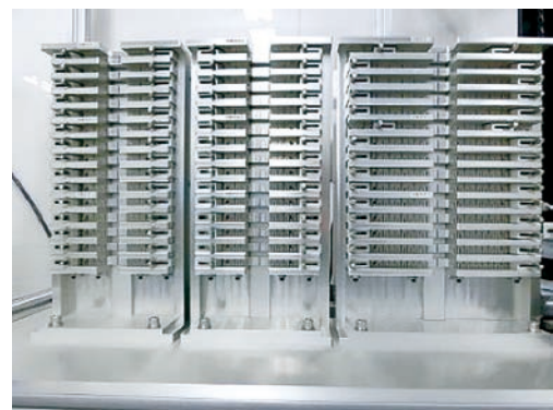
試験片のストック機能(最大で45本)

本装置では、原則としては三点曲げ試験を実施することになります。異なるサイズの試験片に対して、試験を行うことが可能であり、最大で45本の試験片をストックすることができます。試験条件に依存しますが、およそ半日程度で試験が完了しますので、一日で最大90本の試験が可能となります。