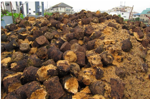
図 2 廃棄された菌床

本特許では排水中の重金属吸着剤に担子菌または廃菌床を活用することを目的として、担子