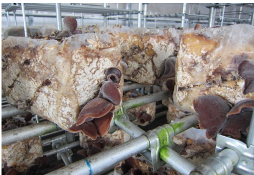
図 1 菌床によるキノコ栽培の様子

レアメタルをはじめとする重金属は世界規模で枯渇が懸念されるなど貴重な資源であり、回収・再資源化に関する技術開発が期待されています。そのため、様々な重金属の回収方法が試みられており、中でも多量の薬品や多大なエネルギーを必要としない微生物を吸着剤として利用した排水処理が注目されています。一方、食用キノコの菌床栽培においては、キノコの収穫後に多量の菌糸を含む菌床が廃棄物として排出されています（図 1,2）。この廃菌床を重金属吸着剤として利用できれば人体に安全で低コストの吸着剤を製造することができると考えました。