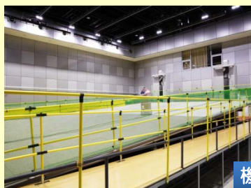
傾斜路走行試験装置 長さ15×幅10mの走行路 ロボットの走行安定性を検証