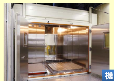
複合環境振動試験機 温度・湿度・振動を変化させ 過酷な環境ストレスの下で評価