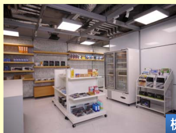
疑似実証実験スペース リビング、トイレ・浴室、 ショップでの利便性を確認