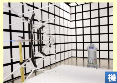
電波暗室 (EMC試験) ロボットが発する 電氣的ノイズなどを測定

東京都は、日本各地と連携して、双方の強みを生かし、双方に高い効果が見込まれる産業施策を「ALL JAPAN & TOKYOプロジェクト」として実施しており、本件はその該当事業です。 ( http://www.sangyo-rodo.metro.tokyo.jp/all-japan/index.html ) 「ALL JAPAN & TOKYOプロジェクト」のお問い合わせ 東京都産業労働局総務部企画計理課 須藤、齋藤 TEL 03-5320-4667