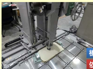
荷重耐久性試験機 加圧装置により ロボット筐体の強度を評価